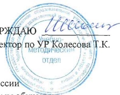
График сдачи зачетов, экзаменов летней сессии 2016-2017 учебного года студентов ЗАОЧНОЙ формы обучения по направлению подготовки 49.03.01 «Физическая культура»