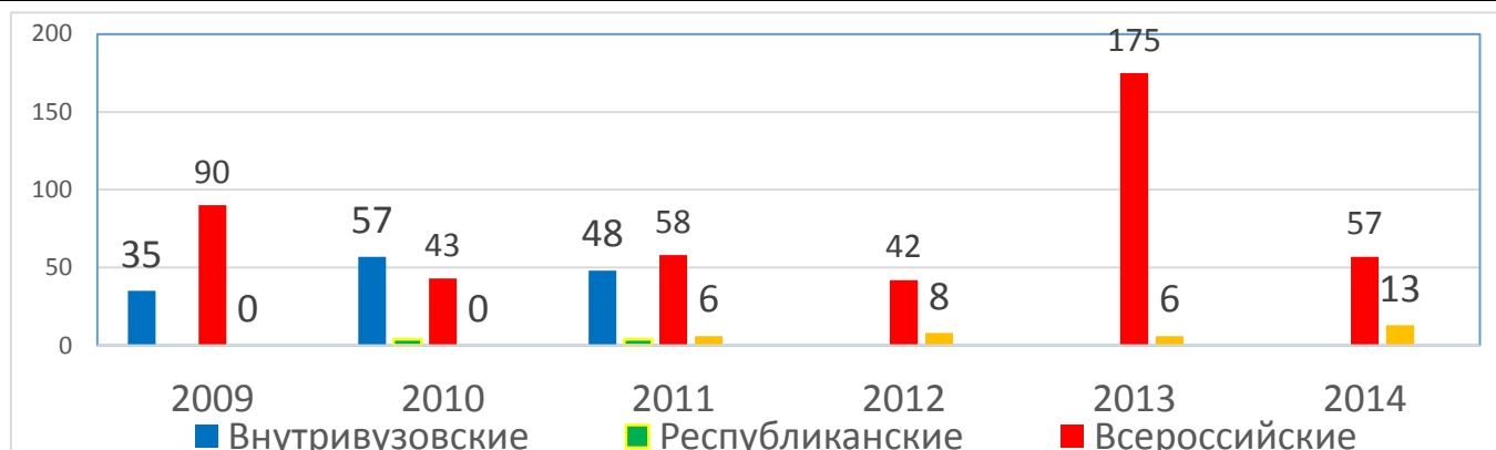
Рис. 1. Количество научных публикаций в разрезе последних 5 лет